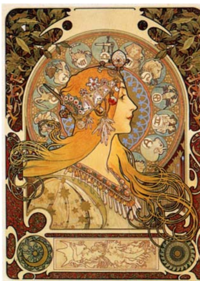
Zodiaco para la revista La Plume. 1896 - 1897