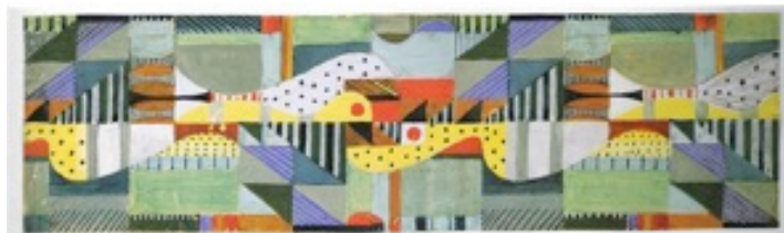
Gunta Stölzl, 1923