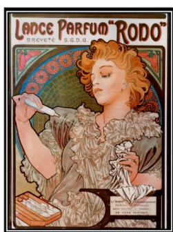
Lance Rodo Perfume, Alphonse Mucha, 1896