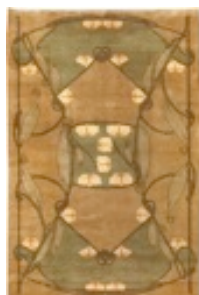
Archibald Knox, 1900

Se presentan cuatro diseños textiles de diferentes estilos. Todos ellos se han basado en un módulo y su combinación para conseguir el diseño definitivo. Siguiendo un esquema modular, haga una propuesta para una alfombra que habrá de tener rasgos estilísticos de uno de los cuatro ejemplos presentados.