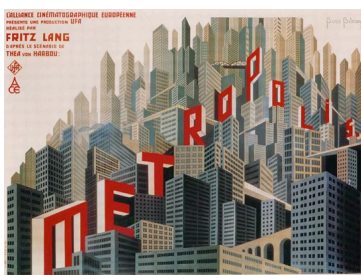
Afiche para la película Metropolis, Boris Bilinsky, 1927