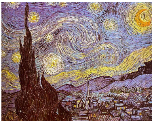
4B. V. Van Gogh: La noche estrellada . 1889.