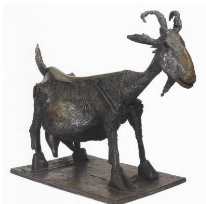
3A. P. Picasso: She-Goat . 1950.