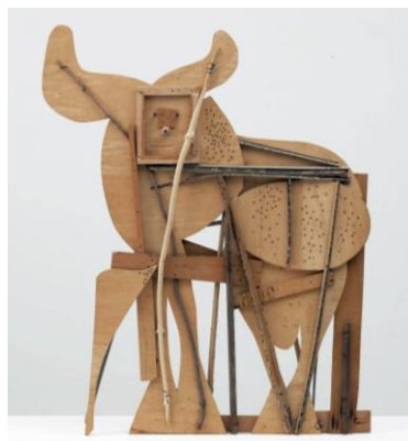
3B. A. 3B. P. Picasso: Bull . 1958.