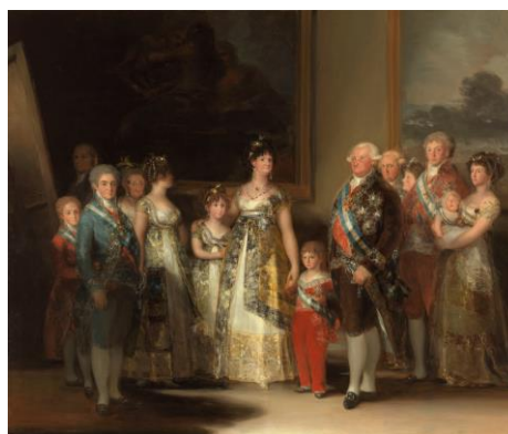
3B. F. Goya: La familia de Carlos IV . 1800.