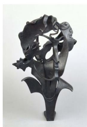
4B. P. Gargallo: Homenaje a Chagall . 1933.