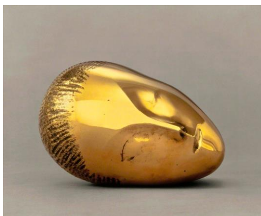
4A. C. Brancusi: Musa dormida . 1913.