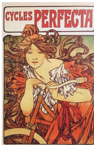
2B. Alfons Mucha: Cycles Perfecta (1902).