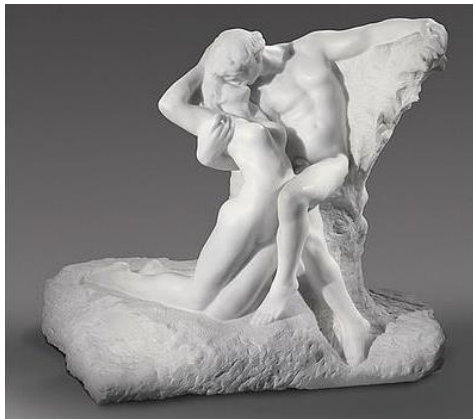
2A. A. Rodin. La eterna primavera , 1884.