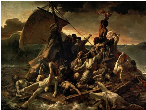
2A. T. Géricault: La balsa de la Medusa . 1819.