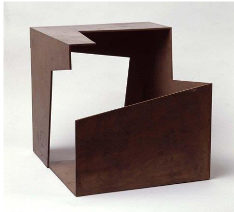
2B. J. Oteiza. Caja vacía , 1958.