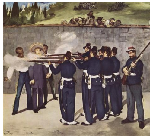
2B. E. Manet: El fusilamiento de Maximiliano I . 1868.