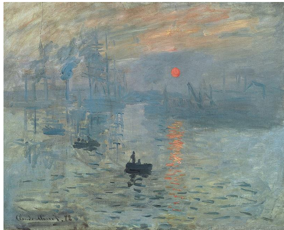
2B. C. Monet: Impresión sol naciente . 1873.