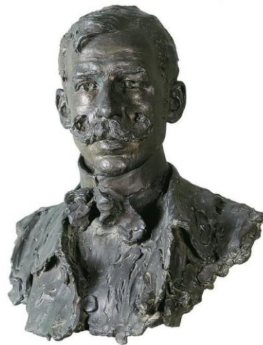
2B. M. Benlliure: Autorretrato . 1900.