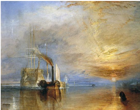
2A. W. Turner: El Temerario . 1839.